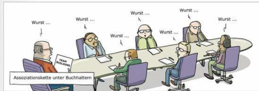
Assoziationskette unter Buchhaltern